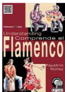
Comprende el flamenco