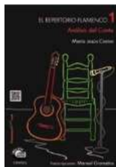
Repertorio Flamenco - Análisis del Cante