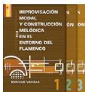
Improvisación modal y construcción melódica en el flamenco Enrique Vargas