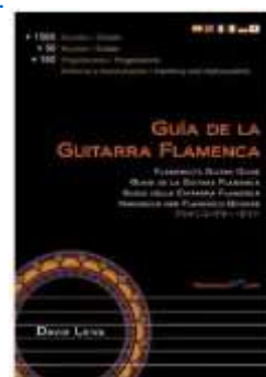
Guía de la Guitarra Flamenca