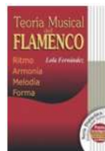
Teoría Musical del Flamenco