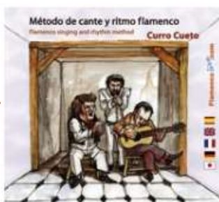
El Método de cante y ritmo flamenco