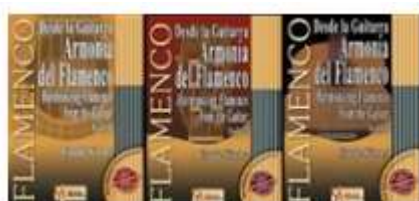
Armonía del Flamenco Claude Worms